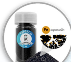
ถ่านกัมมันต์ดัดแปรพื้นผิวด้วยอนุภาคเหล็ก