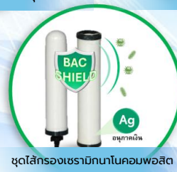
ชุดไส้กรองเซรามิกนาโนคอมพอสิต