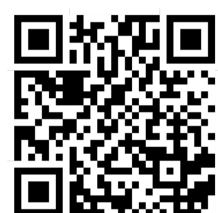
รายละเอียดเพิ่มเติม

นอกจากพื้นที่วิสาหกิจชุมชนกลุ่มเกษตรกรอินทรีย์ตำบลบัวใหญ่ อ.น่าน้อย จ.น่าน สท. และภาคีพันธมิตร ยังได้มุ่งหน้าถ่ายทอดเทคโนโลยีเพื่อยกระดับความเป็นอยู่ของชุมชนอื่นๆ สอดคล้องตามโมเดลเศรษฐกิจ BCG เช่น