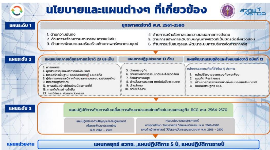
แผนภาพที่ 1 ความเชื่อมโยงของแผนกลยุทธ์ สวทช. กับนโยบายและแผนระดับชาติ