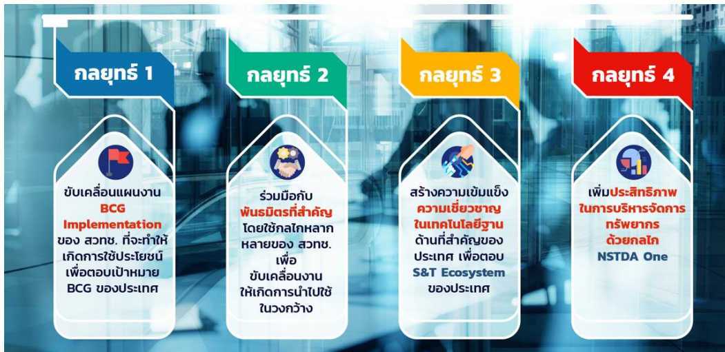
แผนภาพที่ 6 แผนกลยุทธ์ สวทช. ปีงบประมาณ พ.ศ. 2567 - 2571

ให้มีเพียงพอ ต่อการปฏิบัติงานสามารถดำเนินงานสำคัญได้อย่างไม่ติดขัดหรือหยุดชะงัก แผนกลยุทธ์ สวทช. แสดงได้ดังแผนภาพที่ 6