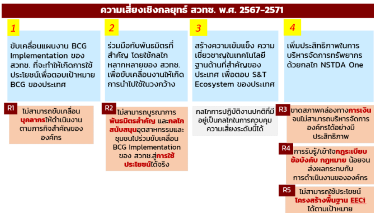
แผนภาพที่ 7 ความเสี่ยงระดับองค์กรที่สอดคล้องกับกลยุทธ์ของ สวทช.

สวทช. ดำเนินการทบทวนความเสี่ยงในระดับองค์กร โดยวิเคราะห์ความเสี่ยงจากการทบทวนสภาพแวดล้อมภายนอกที่เป็นการเปลี่ยนแปลงสำคัญ และปัจจัยภายในที่จะส่งผลกระทบต่อ การบรรลุวิสัยทัศน์ พันธกิจ และเป้าหมายเชิงกลยุทธ์ โดยระบุความเสี่ยงระดับองค์กรที่ต้องบริหารจัดการในปีงบประมาณ 2567 จำนวน 5 รายการ ดังนี้