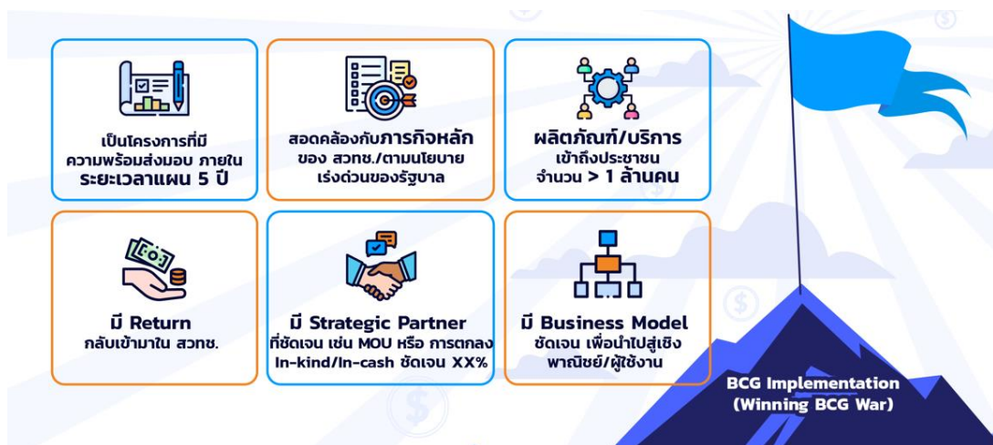
แผนภาพที่ 2 คุณลักษณะของโครงการที่จะทำ BCG Implementation: Winning BCG War

จากการกำหนดกลยุทธ์ศาสตร์เพื่อขับเคลื่อนโมเดลเศรษฐกิจ BCG สวทช. ได้วางยุทธศาสตร์ BCG Implementation (Winning BCG War) เพื่อกำหนดเป้าหมายและจุดมุ่งเน้นของแผนฯ โดยได้วางกรอบการดำเนินงาน โครงการสำคัญ และสิ่งส่งมอบที่จะตอบสนองต่อเป้า BCG ของประเทศทั้ง 4 มิติ ทั้งนี้ได้กำหนดคุณลักษณะของโครงการสำคัญภายใต้ BCG Implementation ไว้ 6 ประเด็น คือ 1) ผลิตภัณฑ์/บริการเข้าถึงประชาชนเป็นล้านคน 2) เป็นโครงการที่มีความพร้อมส่งมอบภายในระยะเวลา 5 ปี 3) สอดคล้องกับภารกิจหลักของ สวทช./ นโยบายเร่งด่วนของรัฐบาล 4) มี Strategic partner ที่ชัดเจน 5) มี Business model ชัดเจนเพื่อนำไปสู่เชิงพาณิชย์/ผู้ใช้งาน 6) มี Return กลับมาที่ สวทช. แสดงคุณลักษณะของโครงการที่จะทำ BCG Implementation (Winning BCG War) ดังแผนภาพที่ 2