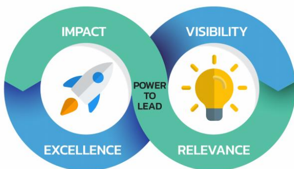
แผนภาพที่ 4 หลักการ (Principles) ในการดำเนินงานของ สวทช.