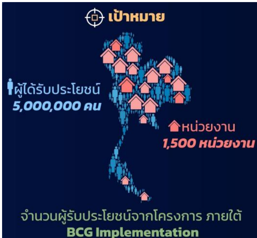
แผนภาพที่ 5 เป้าหมายรายปีของ สวทช.

สวทช. ได้กำหนดเป้าหมายการดำเนินงานของแผนกลยุทธ์ฉบับที่ 7.2 เป็น จำนวนผู้ได้รับประโยชน์จากการนำเทคโนโลยีกลุ่มเป้าหมายไปประยุกต์ใช้ อันได้แก่เทคโนโลยีที่ระบุในแผนงาน BCG Implementation โดยมีเป้าหมายรายปีดังแผนภาพที่ 5