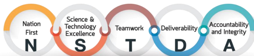
แผนภาพที่ 3 ค่านิยมหลัก ของ สวทช.

เป็นมากกว่าความรับผิดชอบต่อ เพราะหมายถึง ความมีคุณธรรม จริยธรรม ทำงานด้วยความโปร่งใส มีวินัยต่อกฎระเบียบ กติกา กล้ายืนหยัด ทำในสิ่งที่ถูกต้อง และมีความซื่อสัตย์ต่อองค์กรและสายงานอาชีพ