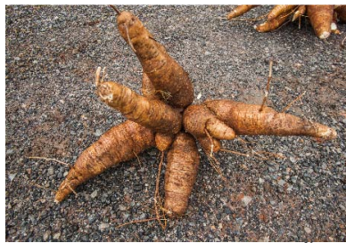
ผลผลิตมันสำปะหลังไม่ให้น้ำ