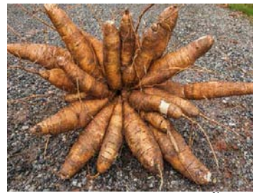
ผลผลิตมันสำปะหลังให้น้ำ